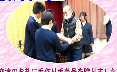
交流のお礼に手作り手芸品を贈りました。