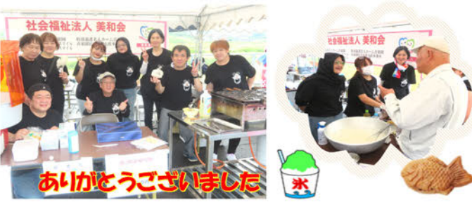
ありがとうございました

バザーコーナーでは たい焼き・カキ氷・綿菓子 を販売し 大変 好評をいただき完売でした。 これからも地域のイベントを通じて 地域の皆様と ふれあう機会を増やして行けたらとています。