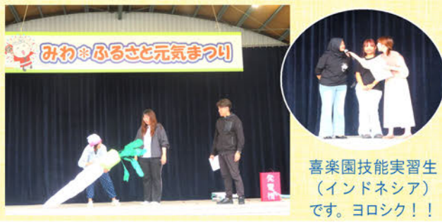
喜楽園技能実習生 (インドネシア) です。ヨロシク!!